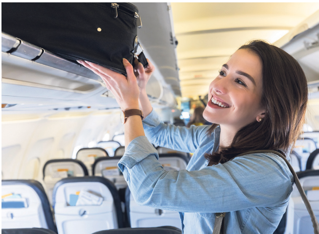
Les voyages d'études, fréquents dans les programmes MBA et EMBA, ont dû être repensés. Un changement temporaire ou pérenne?

Certaines institutions ont donc fait d'autres choix que le voyage en Suisse. Parmi elles, l'IMD, à Lausanne. Son MBA en management prévoit des séjours à l'étranger, mais c'est aussi le cas de son EMBA, ou Executive Master in Business Administration – des formations