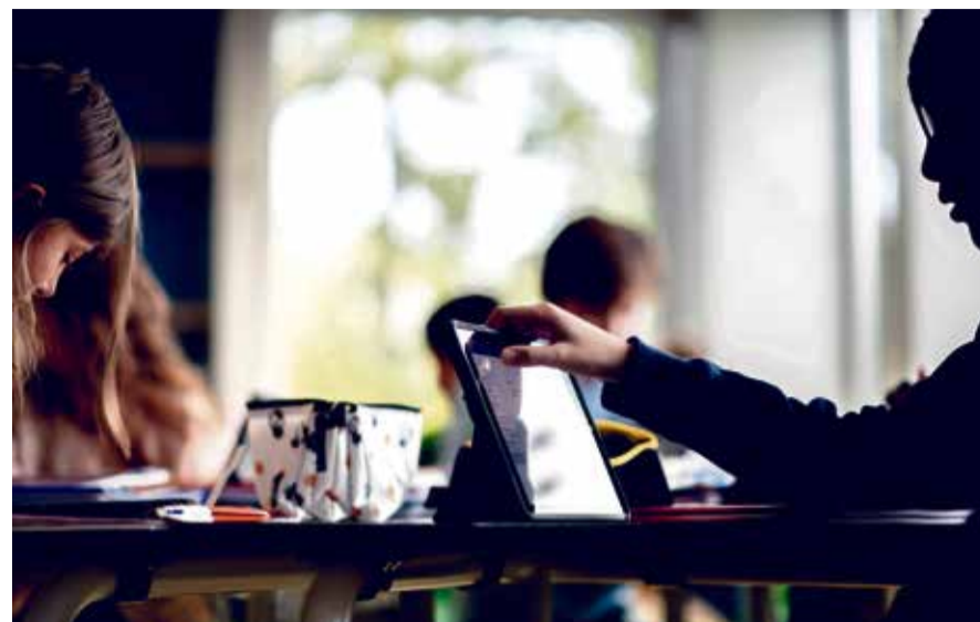
Chacun des 1500 élèves de l'école est équipé d'une tablette numérique.

FORMATION Accélérant la numérisation de la société, la pandémie a exacerbé le débat sur l'informatique. Troisième du Prix SVC Genève, cet établissement n'a cependant pas attendu le virus pour se lancer