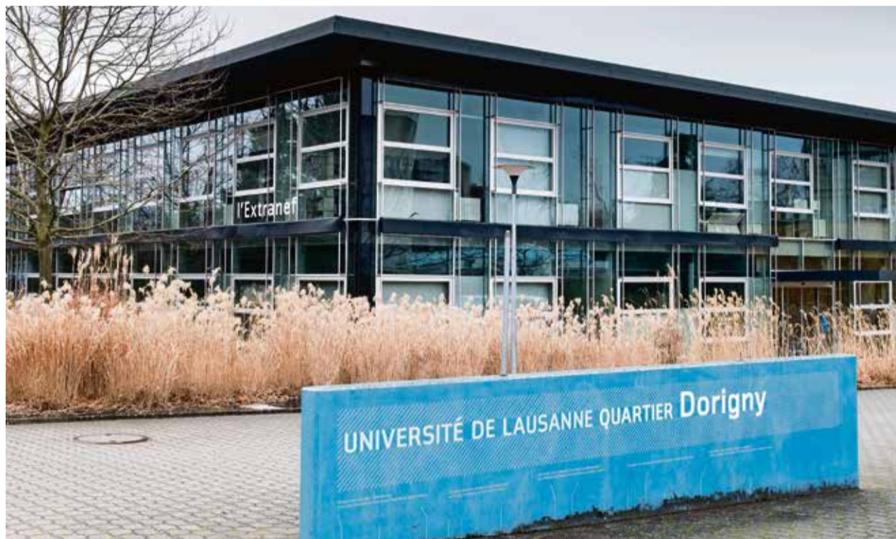
Les universités publiques romandes ont toutes obtenu une décision positive du Conseil suisse d'accréditation.

«Nos programmes sont accrédités selon l'agence d'accréditation américaine IACBE, a réagi l'UBIS. Nous sommes dans le processus de candidature.» L'école estime donc n'avoir «pas de raison de croire qu'un changement de nom sera nécessaire». Et pour elle, suivre ce procédé, au-delà de l'utilisation du terme «université», «fournit des lignes directrices solides pour le fonctionnement d'une entité éducative de qualité». La Swiss UMEF nous a également confirmé être