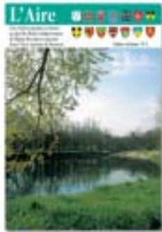
ALIRE : Fiche-rivière N° 5, L'Aire